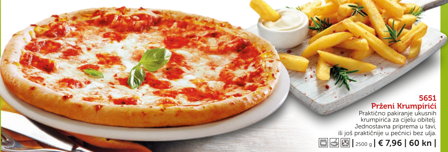
5651 Prženi Krumpirići Praktično pakiranje ukusnih krumpirića za cijelu obitelj. Jednostavna priprema u tavi, ili još praktičnije u pećnici bez ulja. | 2500 g | € 7,96 | 60 kn |

Pizza i krumpirići... omiljeni okusi najmlađih gurmana!