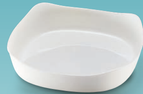
25390 Posuda "Smart Cuisine" Kvadratna cm. 26x26 | € 16,95 | 128 Kn |

Jednostavnog i elegantnog dizajna, ove su zdjele idealne za posluživanje raznih finih salata, ali i za pripremu raznih jela u pećnici koja možete u njima i poslužiti. Proizvedene su od kaljenog stakla koje je dodatno obrađeno kako bi bilo čvršće, izuzetno su lagane i iznimno otporne. Prikladne su za upotrebu u mikrovalnoj pećnici, ali i klasičnoj pećnici do čak 250°C, a zbog glatke i neporozne površine vrlo se jednostavno i lako čiste.