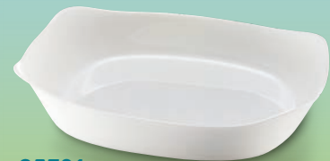
25391 Posuda "Smart Cuisine" Pravokutna cm. 30x22 | € 16,95 | 128 Kn |